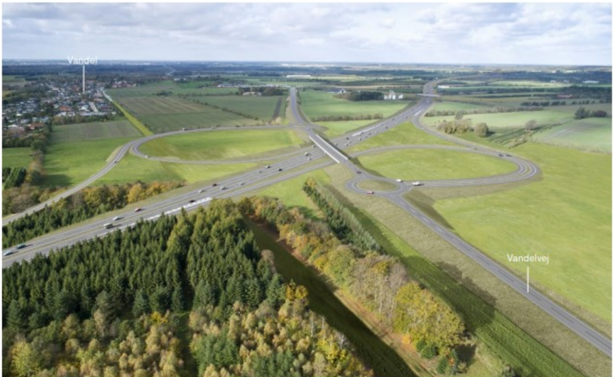
Visualisering: Tilslutningsanlæg ved motortrafikvejen Vandelvej

fra UVM-undersøgelsens Sammenfattende rapport 602 - 2020 s. 54