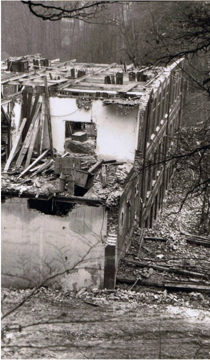
Taget er væk og der er kun to stokværk tilbage. Ruinen er her set fra Turbinetårnet.