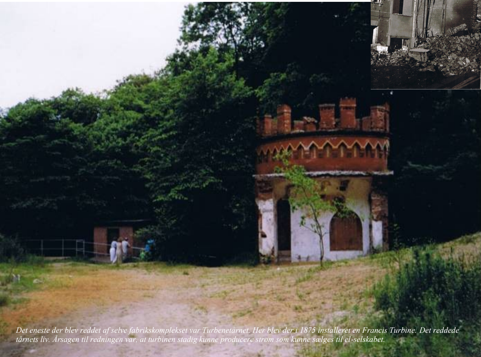
Det eneste der blev reddet af selve fabrikskomplekset var Turbinetårnet. Her blev der i 1875 installeret en Francis Turbine. Det reddede tårnets liv. Årsagen til redningen var, at turbinen stadig kunne producere strøm som kunne sælges til el-selskabet.