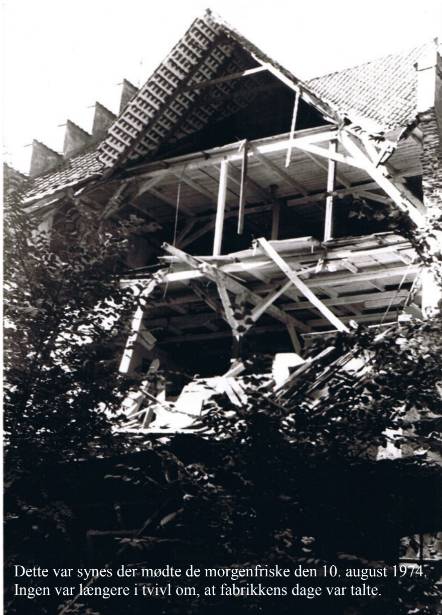
Dette var synes der mødte de morgenfriske den 10. august 1974. Ingen var længere i tvivl om, at fabrikkens dage var talte.