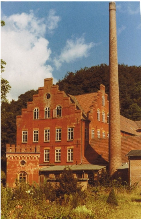
Fabrikken set fra sydvest. Ved skorstenen ses nogle af de mange tilbygninger i fabrikkens gård.