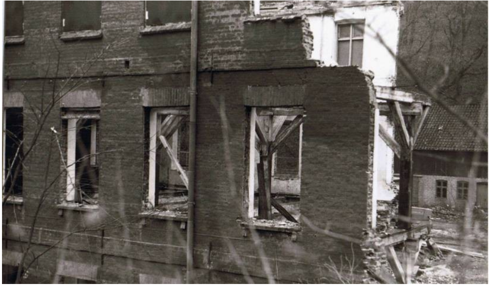
1984 var et trist år. Turen til Vejle blev skæmmet af en ruin, der svandt dag for dag.