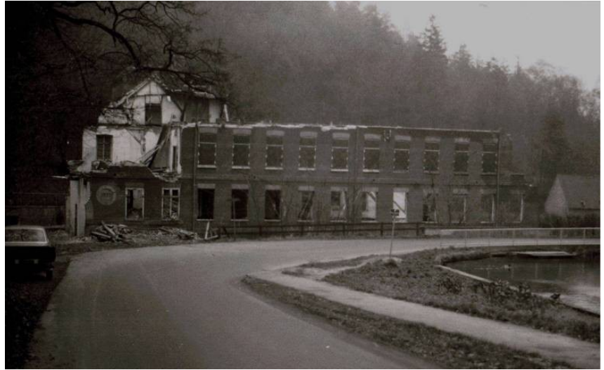
Både tilflyttere og dem, der havde boet i Randbøldal i en menneskealder, hvoraf mange havde arbejdet på fabrikken, var mere end kede af dette triste syn.